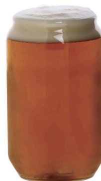
CERVEJA NA LATA PET

Apresentação dedicada do segmento disponível – estudos de mercado, viabilidade e formação de preços.