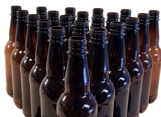
GARRAFAS PET ÂMBAR · PROTEÇÃO UV