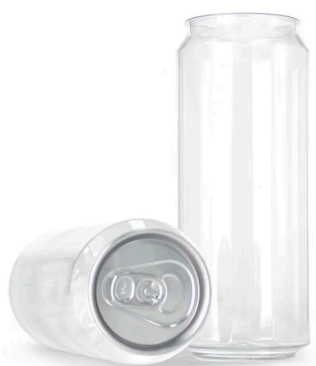
LATA PET · TAMPA EASY-OPEN